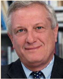
Josef Joffe Herausgeber DIE ZEIT

Sehr geehrte Damen und Herren, liebe Gäste,