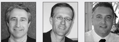
Schmid Zürcher Studer

Workshop durch Wenger & Vieli Rechtsanwälte