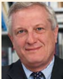
Josef Joffe Herausgeber DIE ZEIT

Sehr geehrte Damen und Herren, liebe Gäste,