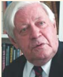
Helmut Schmidt Herausgeber DIE ZEIT